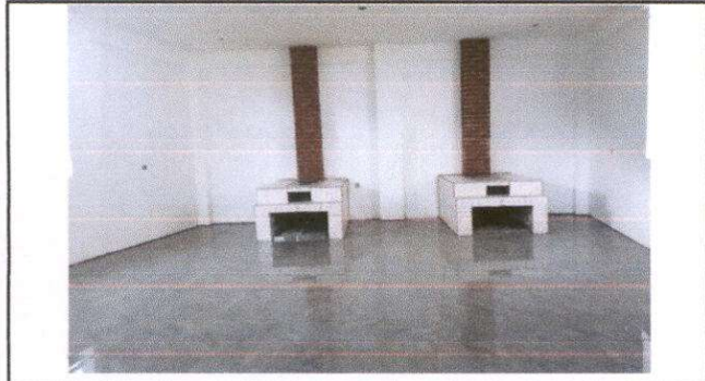
Foto1: Sustitución de chimenea de concreto (cocina)